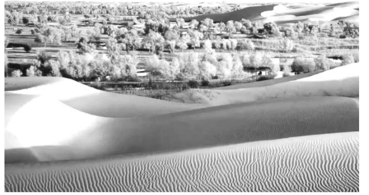
蕴含着大量的有色金属、塔里木盆地真是一块富石油、盐矿等矿产资源的宝地！

等瓜果，物产十分丰富。塔里木盆地的东部是著名的罗布泊湖盆地。罗布泊是有名的“游移湖”，因河流改道湖泊曾多次移动位置。罗布泊基本汇集了盆地中的全部河，全长2000千米。塔里木盆地曾是古代丝绸之路的“咽喉”，汉代的丝绸就经过这里运往古罗马；印度的佛教也由这里传入中国。在塔里木盆地中，还