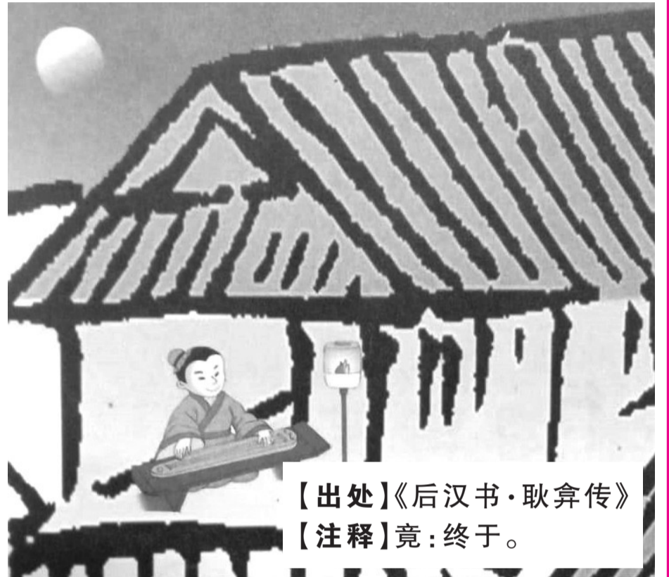
【出处】《后汉书·耿弇传》 【注释】竟：终于。